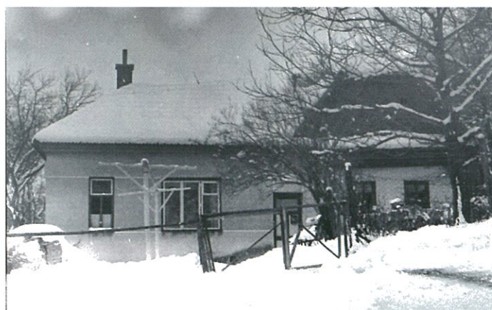
Chalupa č. 113 kolem r. 2000 - zima