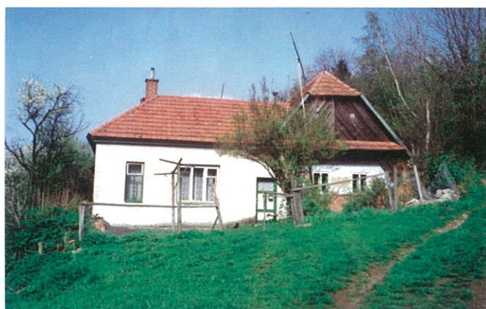
Chalupa v létě