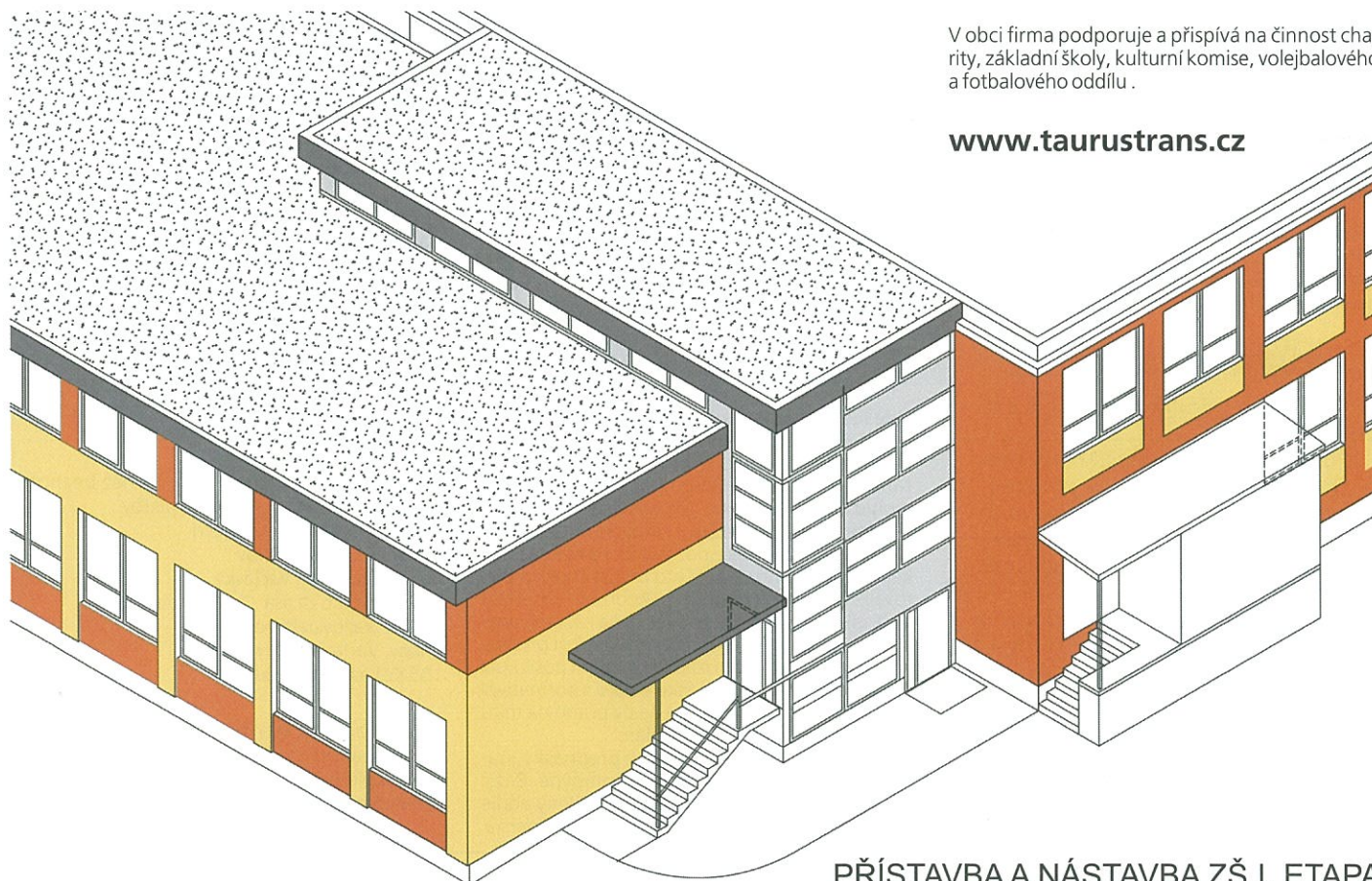
PŘÍSTAVBA A NÁSTAVBA ZŠ I. ETAPA