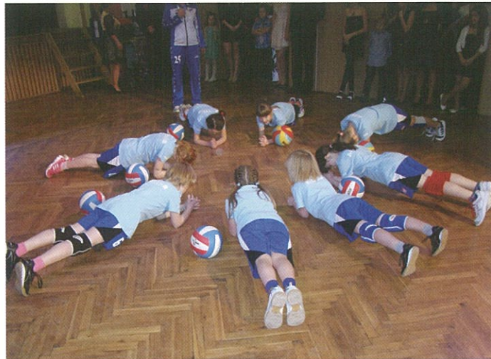
VYSTOUPENÍ NEJMENŠÍCH SPORTOVců